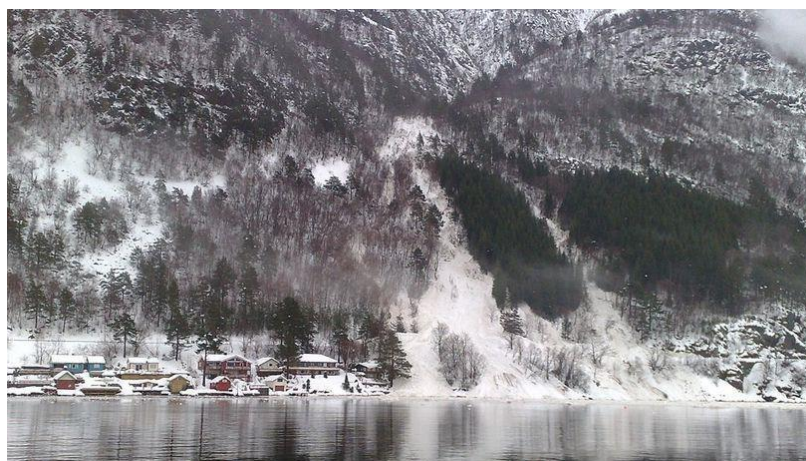
Snøras over riksveg 70 i Oppdølstranda, mars 2010

Ansvarlig for ajourhold: beredskapskoordinator